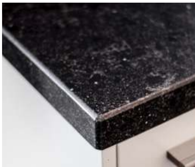
Voorbeeld van gezoet composiet.