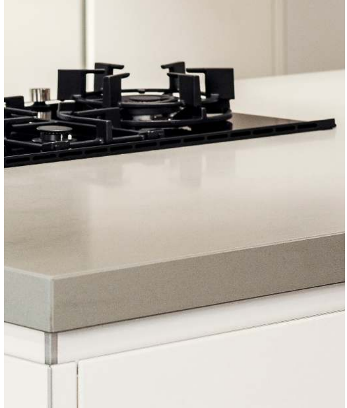
Voorbeeld van gepolijst composiet.

Gepolijst composiet is glad, terwijl gezoet of gebrand composiet te herkennen is aan het reliëf.